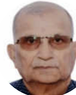
VOGAL- RELIGIÃO CANTILAL CARSANE